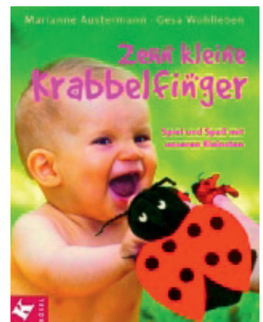
Pustebume: „Zehn kleine Krabbelfinger“ Kösel-Verlag, 17,95 € ISBN 978-3-466-30570-4

Die Freude am Singen wird durch viele Liedtexte mit Noten unterstützt. Eine CD gibt's auch dazu, falls Sie nicht so das Gesangstalent sind.